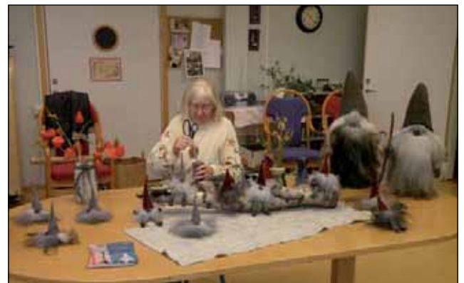
Hantverk visas på Rönningegården.