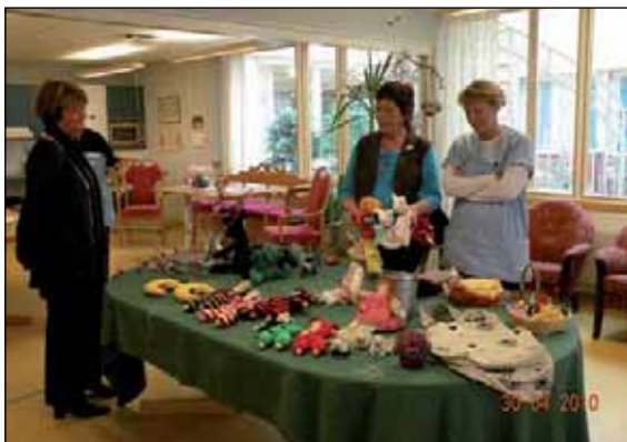
Lokala konsthantverkare visar sin alster på Rönningegården.