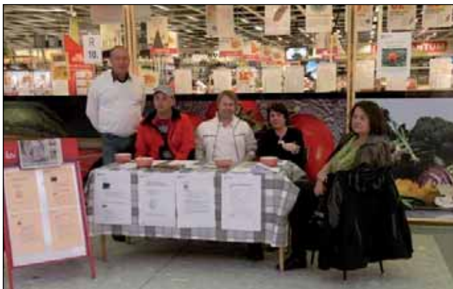
IFO-enheten informerar om kommunens råd & stöd i Köpstaden.