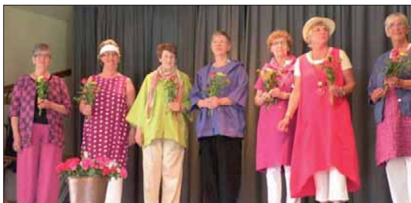
och av bättre begagnade kläder från Kupan.