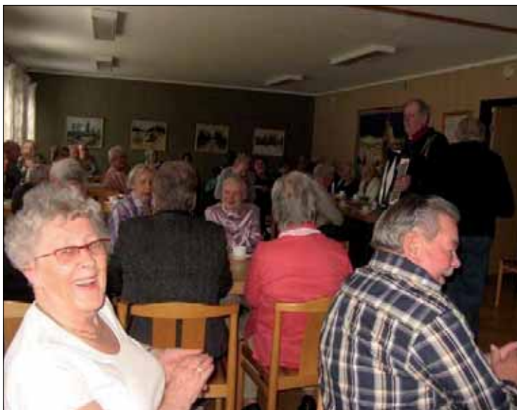
Betydelsen av föreningsliv, ha roligt, skratta, positiva tankar och meningsfullhet, att känna sig sedd, hörd och bekräftad. Bild från Lindås.