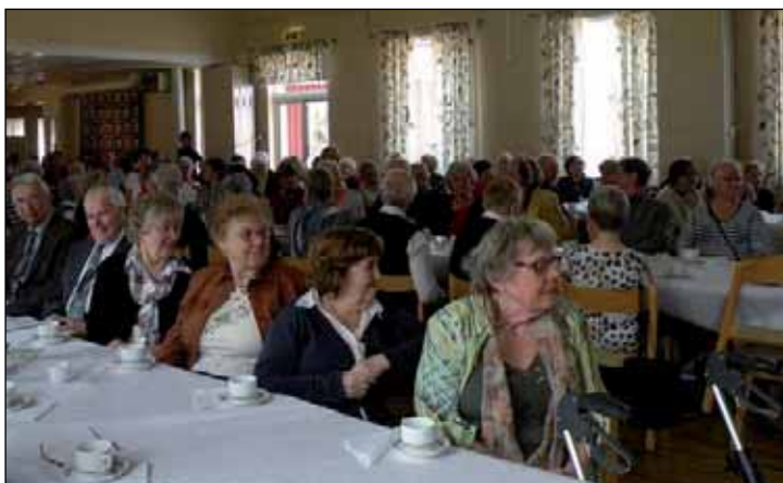
Fullsatt i Ladan då det var modevisning,