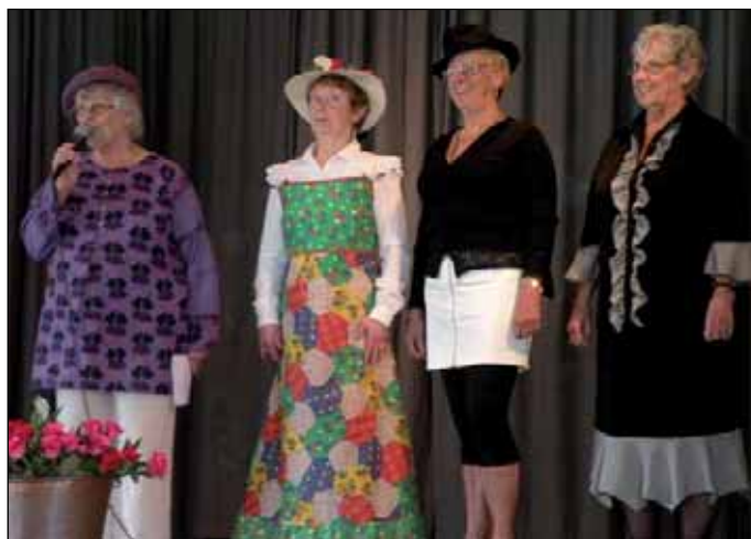
av nya kläder från Sol & Vindar