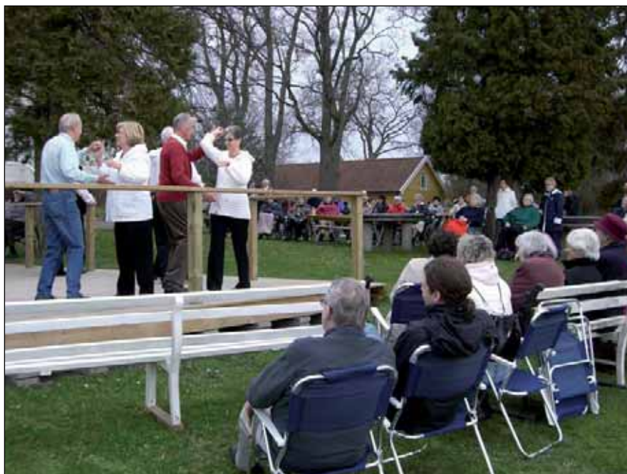
Bilden är från Hembygdsgården i Mönsterås där 160 seniordansare hade dansuppvisning och kaffeservering.